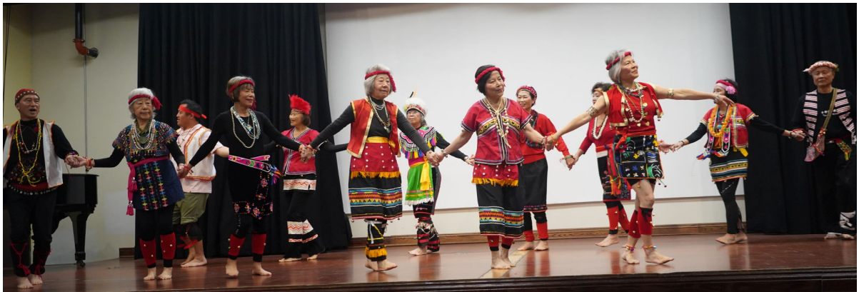
2/1/2025 聖地牙哥台灣同鄉會年會暨春節聯歡會