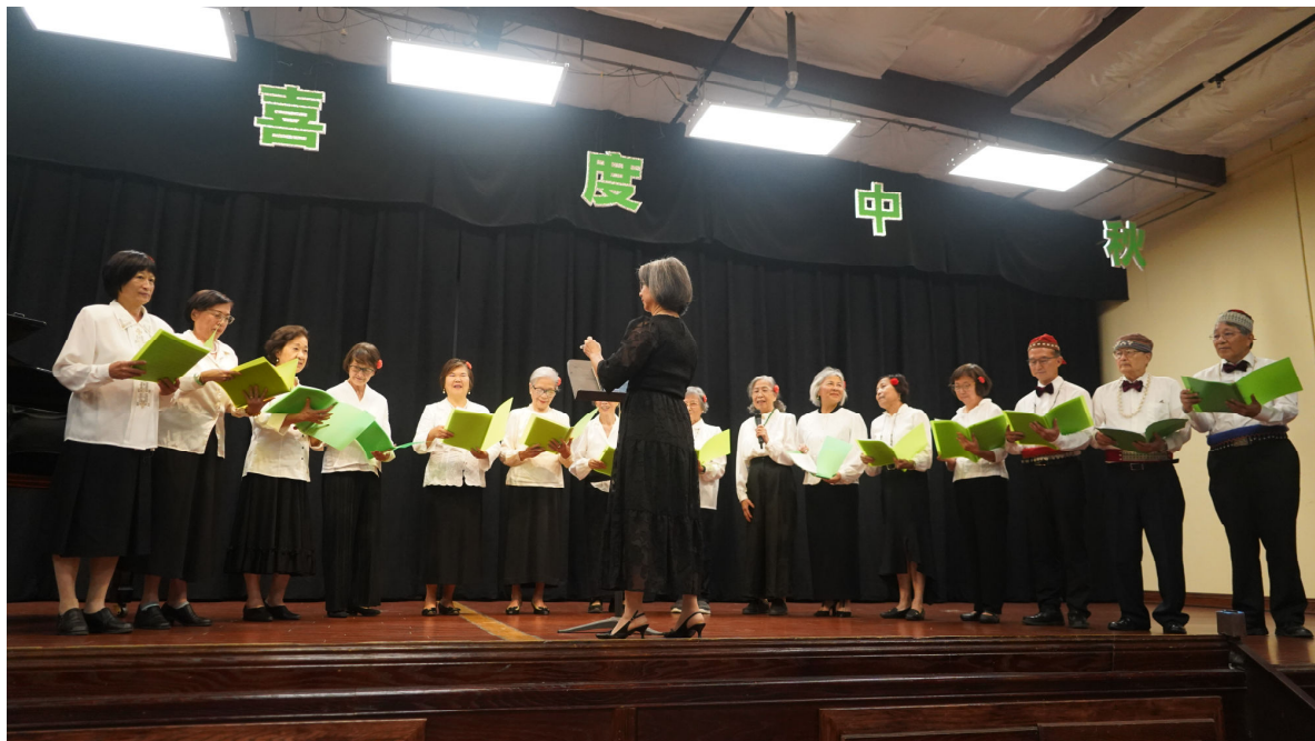
聖地牙哥台灣同鄉會中秋節慶祝會於九月二十一日舉行