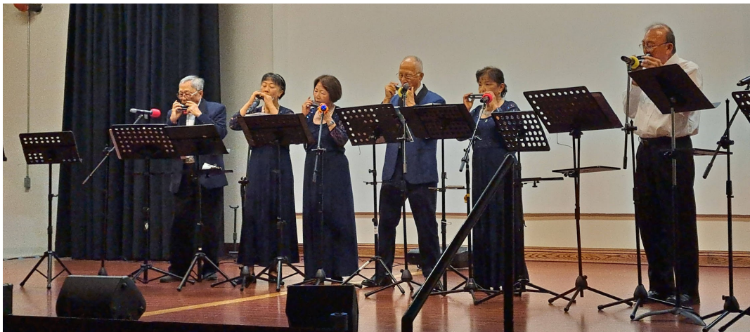
8-17-2024 爾灣愛樂口琴團 Music Fun Day 演奏會