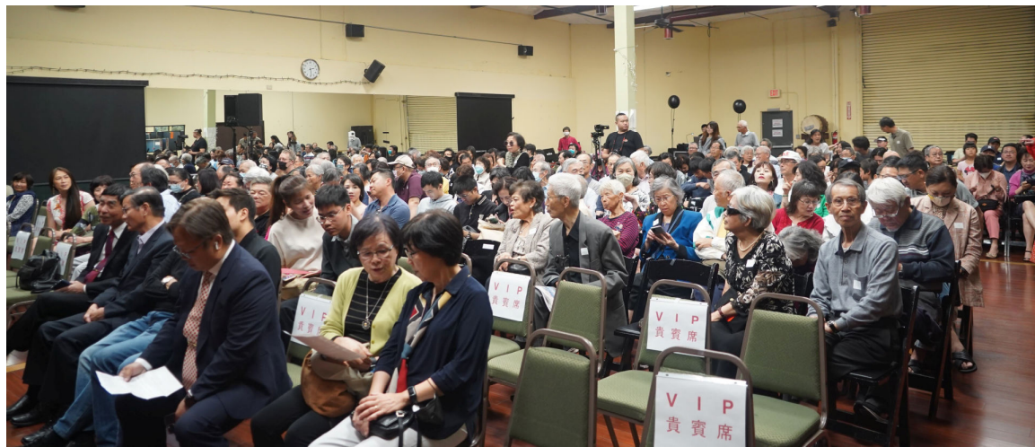
灣聲樂團六月十七日在台灣中心演出