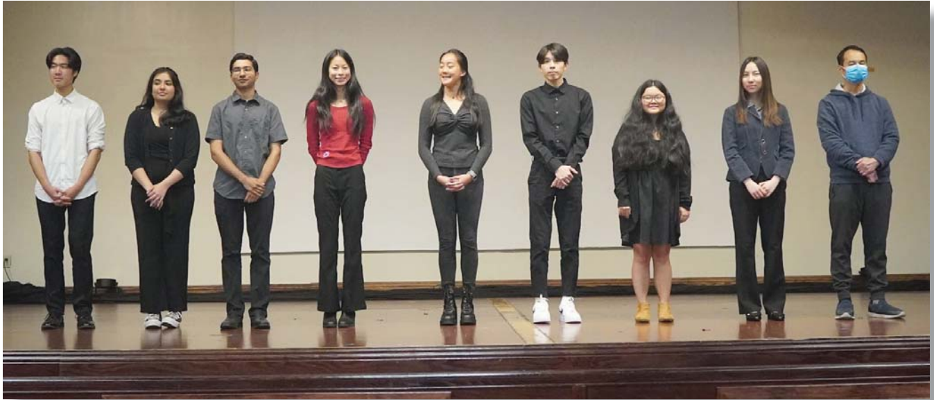
2023應屆高中生獎學金及台灣獎得主