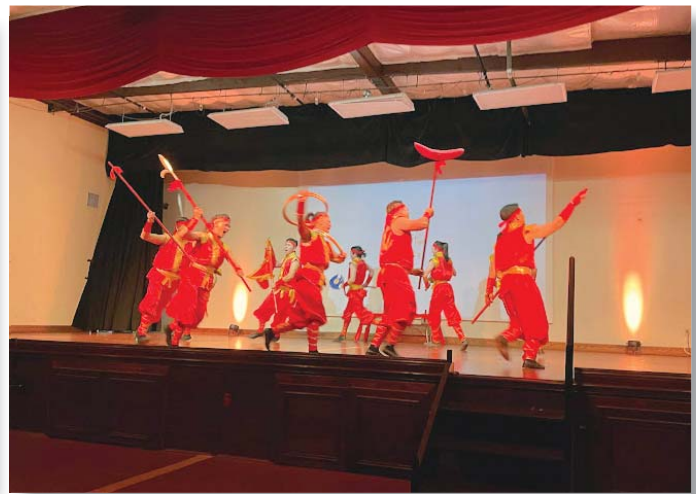
台灣戲曲學院『台灣特技團』精彩的表演