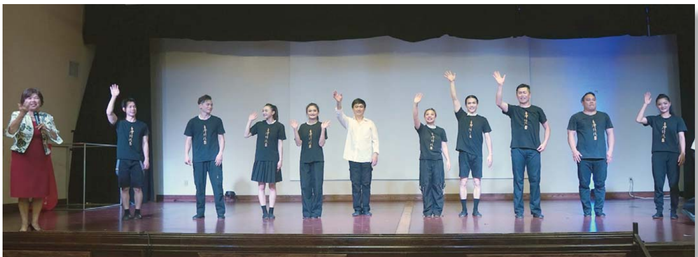
台灣戲曲學院『台灣特技團』團員於表演後和觀眾揮手道別