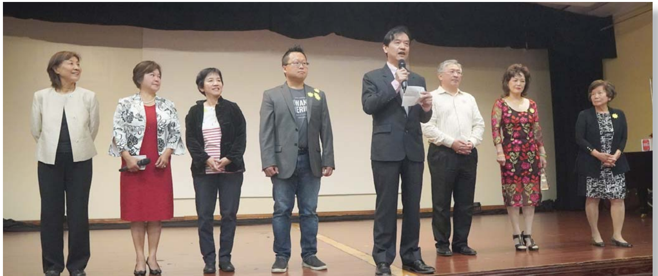
2023聖地牙哥台美基金會董事