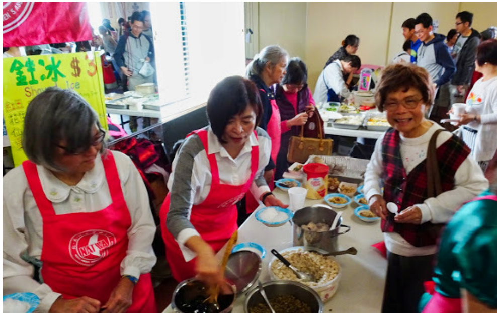
5/19/2018 聖地牙哥台灣傳統周美食園遊會