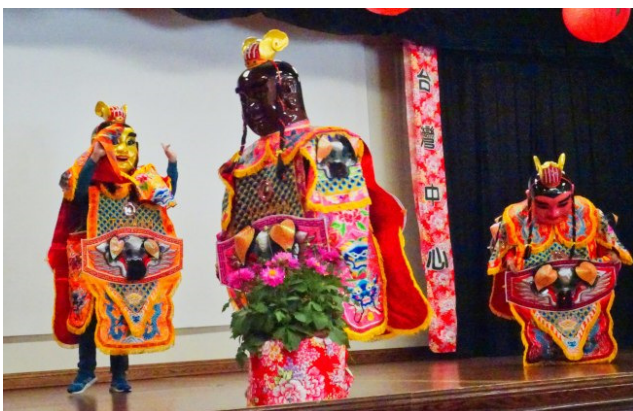
象徵台灣傳統廟會習俗的三太子也蒞臨現場勁歌勁舞。