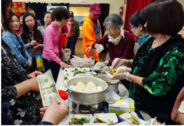
刈包人氣旺，不到一小時全部賣光光。