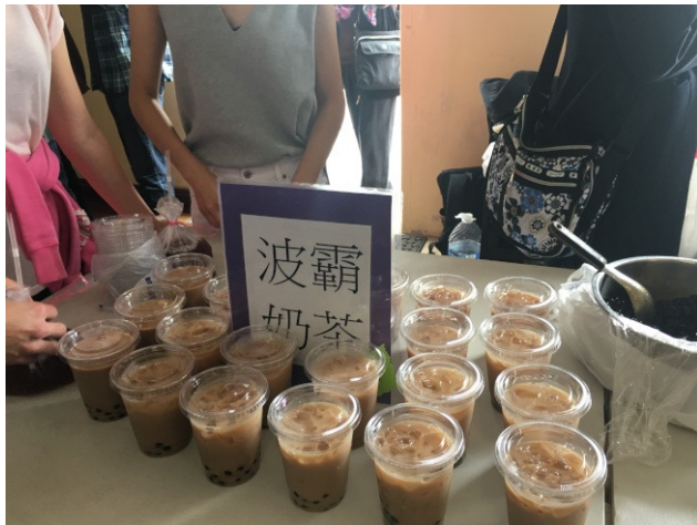
正宗台灣油飯，香氣十足。