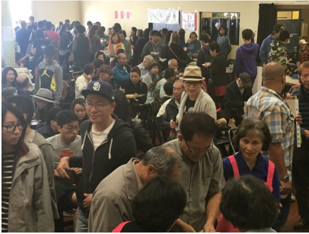
聖地牙哥台灣美食園遊會人潮洶湧。