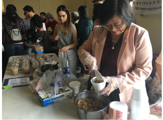
正宗台灣油飯，香氣十足。