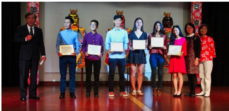
台美基金會頒發應屆高中生獎學金，獲獎學生合影。

為了讓台僑感受新世代家鄉影劇，20至25日下午2時還有「台灣電影欣賞」活動，包括透過時間記錄提醒台灣不可走回灰暗歷史輪迴的「并：控制」、描寫台灣農民故事的「無米樂」、渴望愛情的都會男女愛情劇「52 赫茲 我愛你」，以及改編自王政忠 921 台灣地震真實故事的「老師 你不會回來」等，皆是動人的近代電影小品。