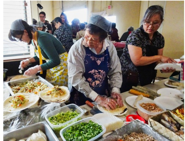
道地家鄉美味，只有台灣美食園遊會吃得到。