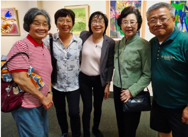
「新藝畫會：2018 傳統週特展」呈現台灣優秀畫家作品，響應台美傳統週。