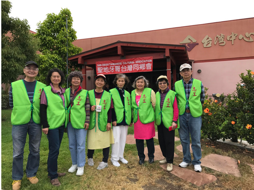
園遊會同鄉會義工合影