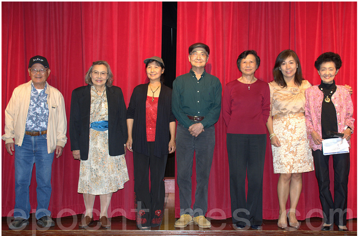
台灣同鄉會 2016 年理事會全體成員