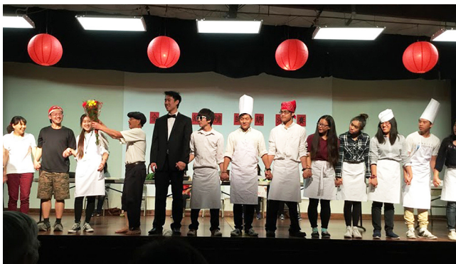
年輕人表演的廚藝秀短劇。