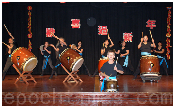
開場的太鼓表演。