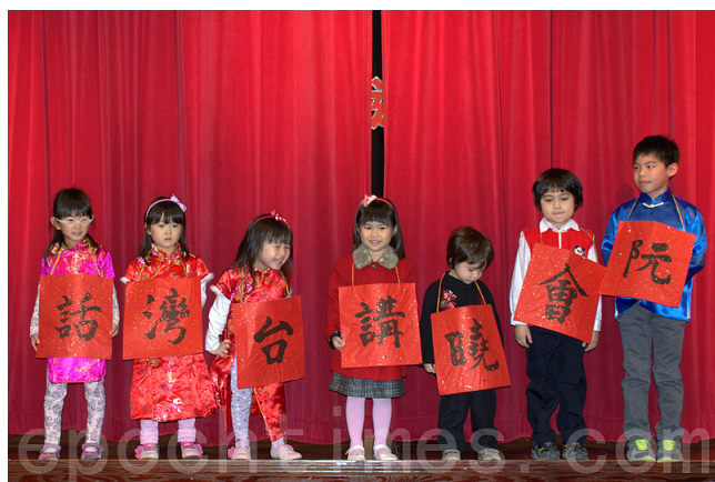
小學童說新年祝福話。