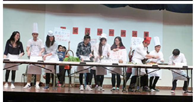
02/13/2016 (六) 《台灣同鄉會年會暨新春晚會》