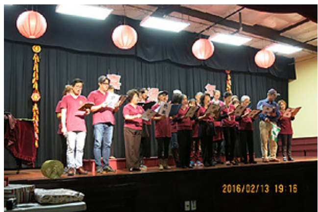
02/13/2016 (六) 《台灣同鄉會年會暨新春晚會》