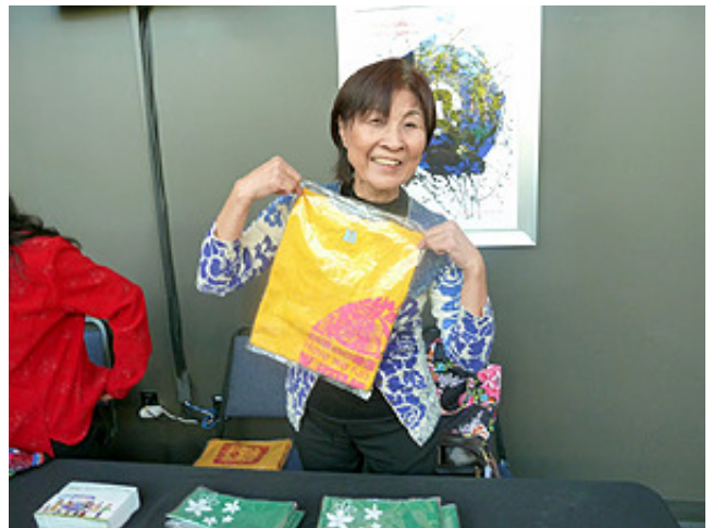
11/14/2015 打狗亂歌團音樂會@UCSD