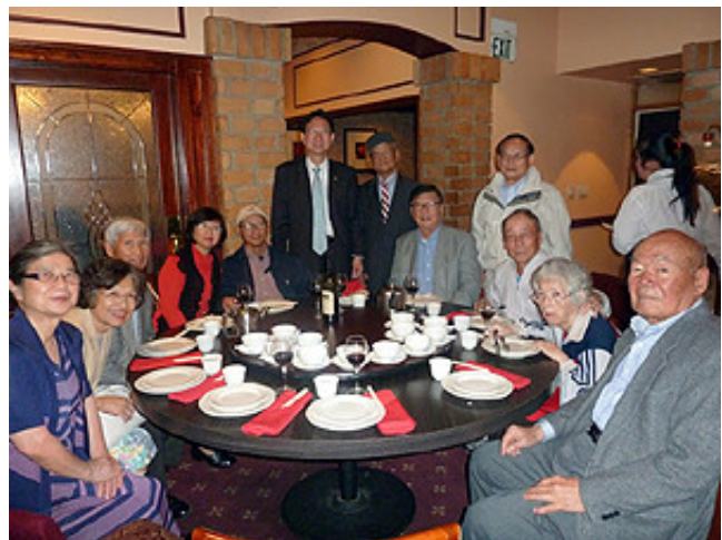
11/15/2015 特別演講：台灣選舉與兩岸關係（童振源）