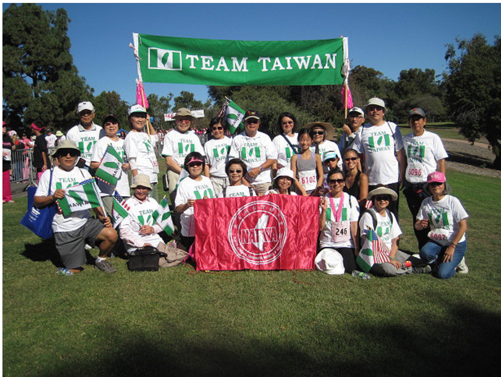
11/1/2015 Koman Race for the Cure - Team Taiwan