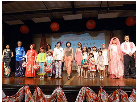
2/28/2015 台美基金會募款餐會