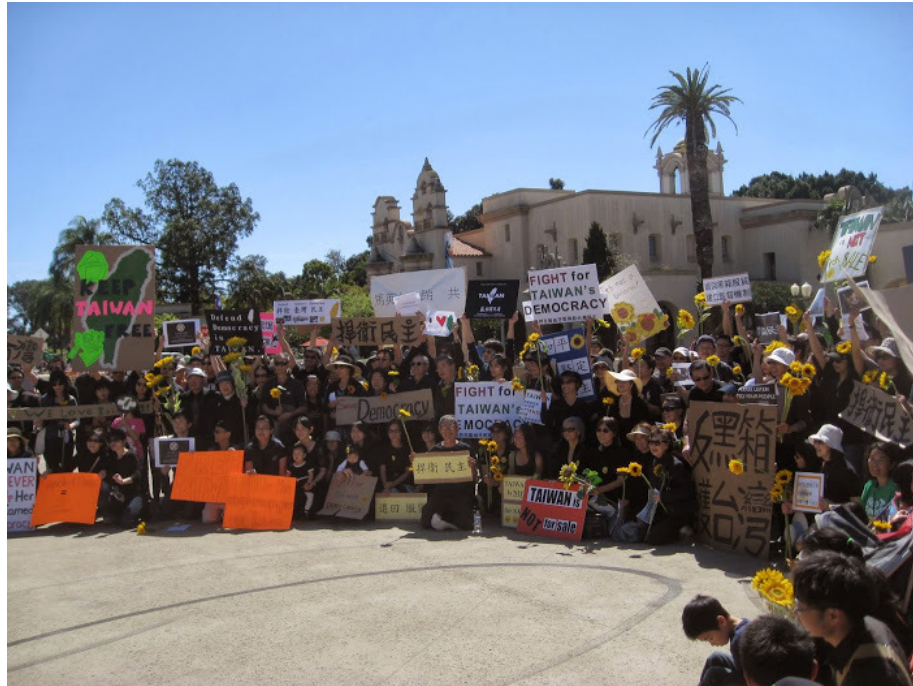
聖地牙哥 330 反黑箱服貿活動