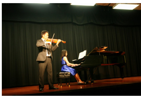
2014 年聖地牙哥台灣傳統週開幕式