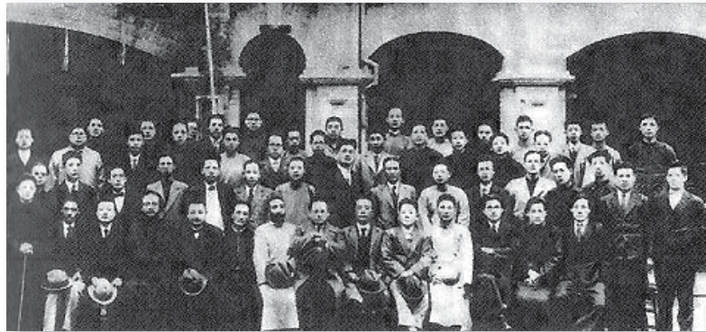
台灣民眾黨第一次黨務磋商會，1927年

當時主導台灣社會運動的力量，其實是包含著兩股不同的勢力。一部分的社運人士打著「民族自決」的大旗，他們聯合台籍的資本家，來對抗日本的帝國主義。他們主張從設置台灣議會開始著手，先讓台灣人取得政治實力，再來達成台灣自治的目的。