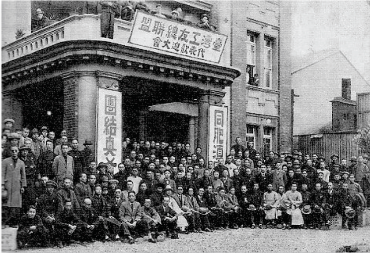
「台灣工友總聯盟」在台北市蓬萊閣舉行成立大會，1928年

壓倒性的票數通過渭水先生提出的黨綱修正案。這時在會場外面監視的台北警署署長，立即率員警進場，以「民眾黨」違反法令為理由，當場宣布政黨解散處份。同時命令員警立即逮捕包括渭水先生在內的16名「民眾黨」主要幹部（但是三天後即獲釋）。成立僅僅三年六個月的「台灣民眾黨」，就此遭到解散的命運。