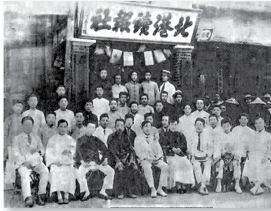
台灣文化協會北港讀報社

「台灣文化協會」果然於1921年10月17日在台北市靜修女學校舉行成立大會，與會的社會人士以及青年學生一共有300多人，他們推舉林獻堂為總理，楊吉臣為協理，渭水先生為專務理事，創立會員總共有1032人。